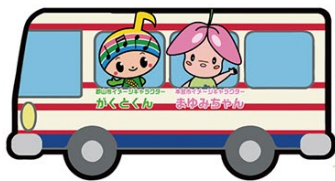
がくとくん⇄まゆみちゃんライン ～郡山と本宮をつなぐ圏域間路線バス～