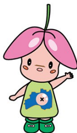
本宮市イメージキャラクター まゆみちゃん

子育てについて困ったとき、悩んだとき、相談したいとき、詳しい情報を知りたいときなどはいつでもお気軽にお問合せください。