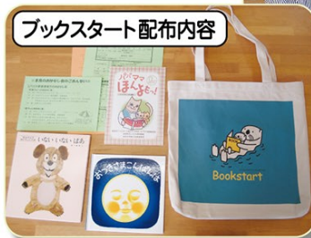
ブックスタート配布内容