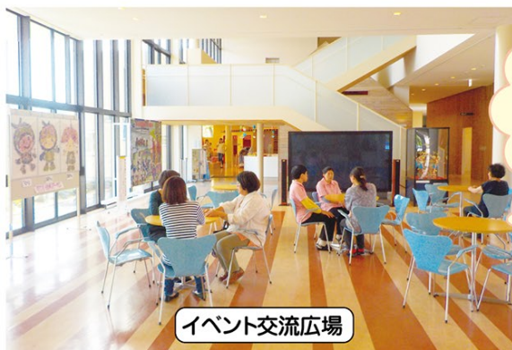
イベント交流広場

施設主催の様々なイベントが行われるとともに、103インチの大型テレビが設置してあります。市民の好奇心を刺激し、つながりを強く感じる空間です。