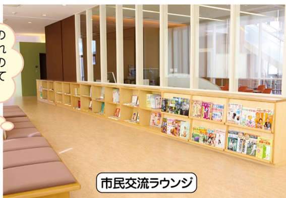
市民交流ラウンジ

小学生の図鑑や科学遊びなどの遊具により多世代の交流が図れます。カブラ（木片積木：魔法の板）コーナーで建物や街を作ってみましょう。