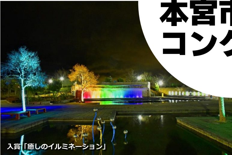
入賞「癒しのイルミネーション」