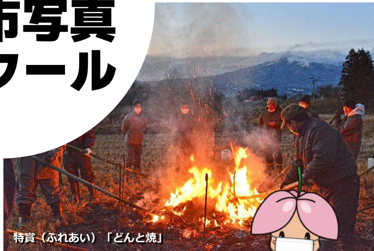
特賞（ふれあい）「どんと焼」