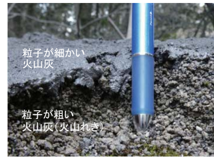
(新燃岳(霧島山), 2011年) 火山灰が積もった斜面の断面 粒子が細かい火山灰によって、地表面が覆われています。

1991年(平成3年)の雲仙普賢岳、2000年(平成12年)の有珠山や三宅島の噴火でも降灰後の降雨による土石流で多くの被害が発生しました。