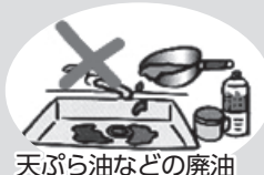
天ぷら油などの廃油