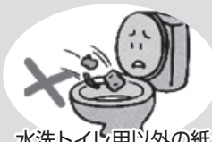
水洗トイレ用以外の紙