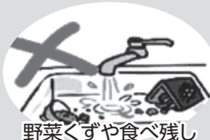
野菜くずや食べ残し