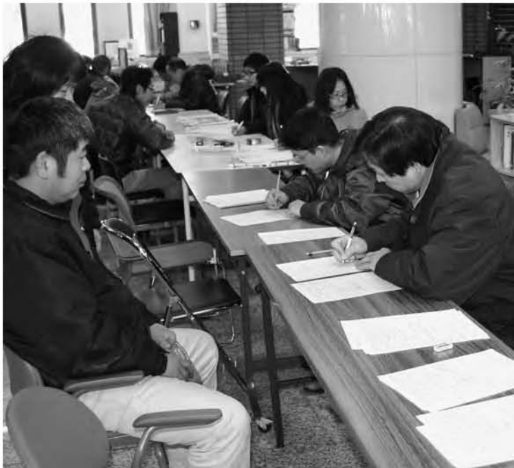
震災翌日から、被害を受けた市民が市役所へ相談に訪れました