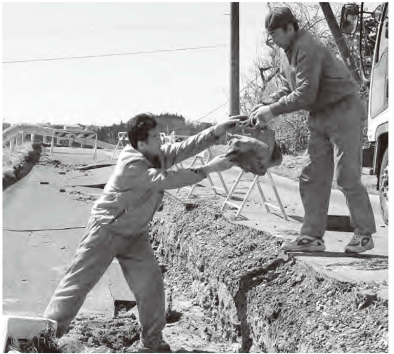
市内の道路・歩道でも崩落・陥没など大きな破損が発生しました。(4月7日現在の市内通行止め16カ所)