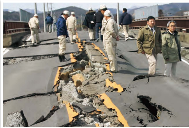
道路が大きく隆起・陥没した富士内・上沢線(仁井田字四合田)

議会では、翌日に議員を緊急招集し、市長から被害状況報告を受け、日程を短縮して3月定例会を開催しました。