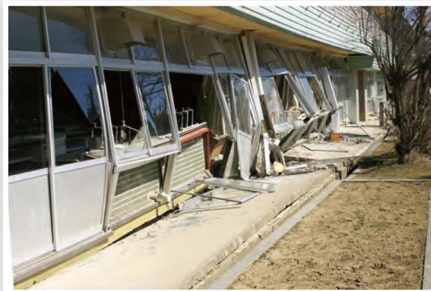
大きな被害が出た本宮第二中学校南校舎(荒井字団子森)