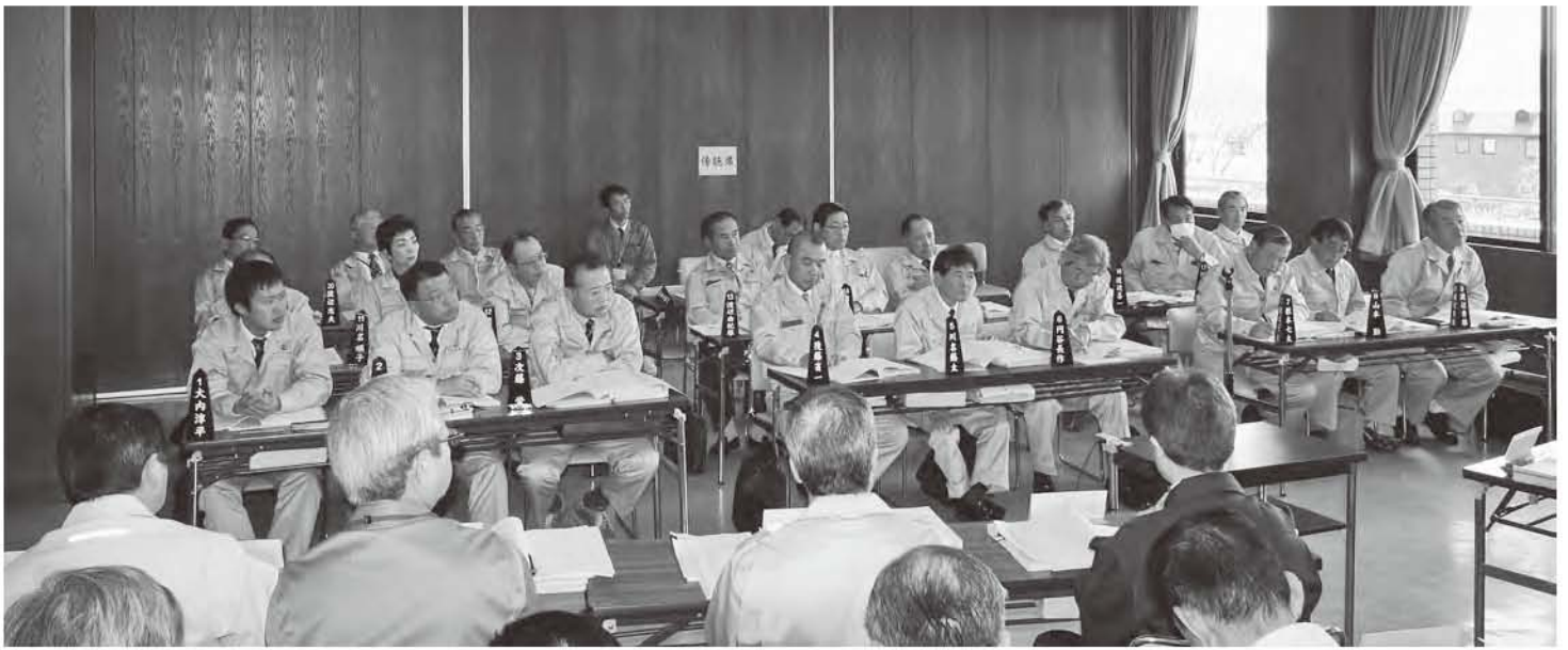
地震により議場の天井・照明器具等が破損したことから大会議室に変更して議会を開催しました

3月定例会（第2回本宮市議会定例会）は、市長から新年度予算10件を含め、各種会計の補正予算や条例の制定など33議案と報告1件が提出されました。 また、最終日には市長から追加議案9件と、議会から東北地方太平洋沖地震に対する緊急要請の発議1件、継続調査申出書5件が提出され、すべて原案のとおり可決しました。 主な議案を要約してお知らせします。