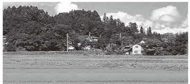
農繁期を迎え米・野菜など今後の作付が心配だ！

答 生産者は食べられないもの、売れないものを作るのかという感情は当然だと思うが、農地は守らなければならない。補償があるからいいというものではない。国へ被害に対する補償の担保を求め、農地を守っていくことが大切である。