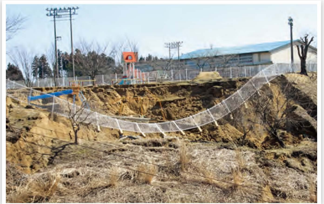
遊具が崩落した白沢保育所園庭(糠沢字五味内)