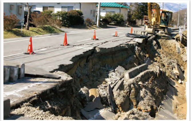
道路・歩道が崩落した石神・堤崎線(糠沢字石神)