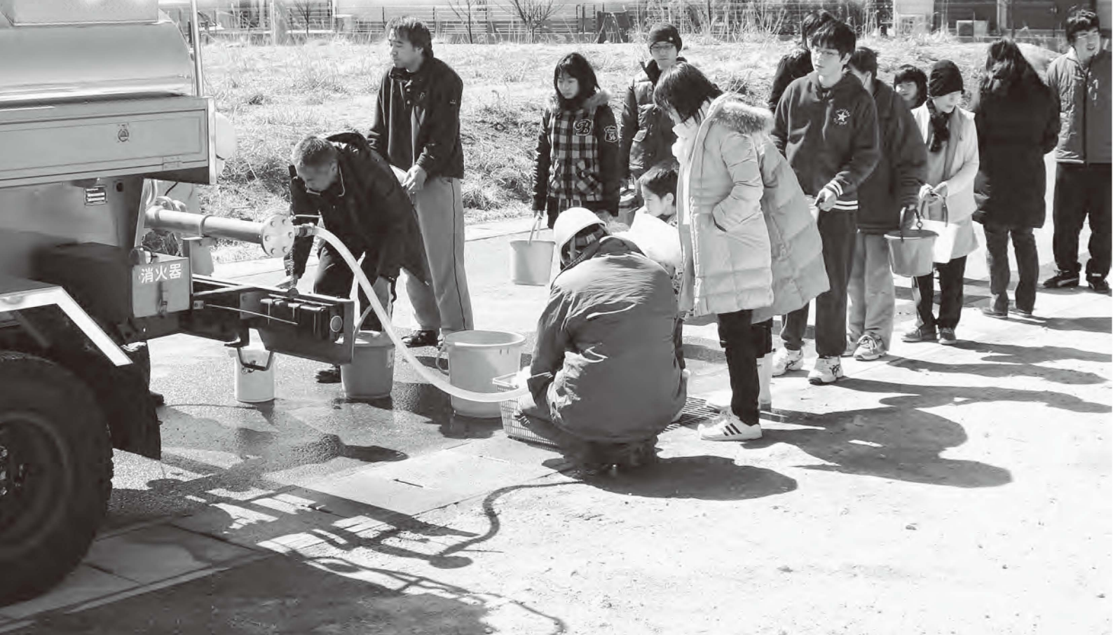
地震による水道の断水が発生し給水所に並ぶ市民（岩根字みずきが丘地内での給水活動）