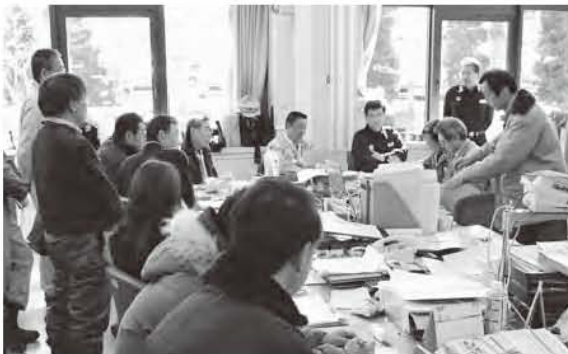
東北電力へ停電の早期復旧を求める市長(中央奥) (3月12日災害対策本部)

答 現場主義を貫く考えを訴えて来た。災害対策本部から離れるべきではないという考えがあった。とにかく現場の復旧に努めた。防災無線で市民に情報を伝えてきたつもりでいたが、メッセージとしては伝わらなかった。最高責任者として、対策本部を離れることは難しいと考えている。