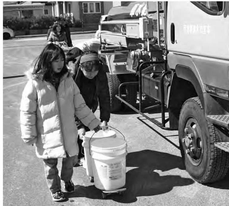
断水した水道が復旧するまで給水車が出動しました