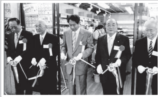
ふるさと交流市場のテープカットの様子

市では、農業振興事業の一環として、首都圏における「農産物の販路拡大」を進めています。私は「農業が元気になるならば、地域の活性化は望めない」と考えており、これからも重点的に取り組んでいきます。 市内で生産される安全でおいしい農産物は、学校給食への活用など「地産地消」が基本ですが、これからは「地産外消」も重要になってきます。農産物の販売ルートを確認することにより、農家の皆さんは安心して農産物の生産ができ、所得の向上にもつながっていきます。