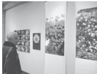
▲写真を見る観覧者