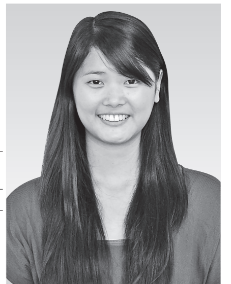
ワン・キャシー・デア・ユアン先生