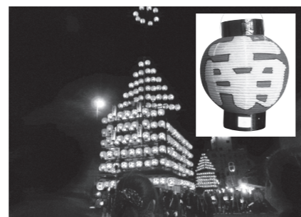
▲太鼓台と作成した提灯

宝くじ助成金を活用 太鼓台の提灯を作製しました 本宮市秋祭り保存会では、秋祭りで使用する提灯が老朽化したため、宝くじ財団の「コミュニティ助成事業」を活用し太鼓台の提灯を700個作製しました。今後も本宮市秋祭り保存会では、先囃子を通して、子どもたちの健全育成と青少年の豊かな心を育てながら地域コミュニティの創