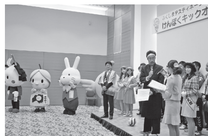
▲応援団長のタレントなすびさんと共に、福島県・本宮市をPRします

平成26年4月から平成28年6月までの約3年間、観光宣伝販売キャンペーン(ディスプレイネーションキャンペーン)が福島県で開催が決定しました。10月16日、福島市でその前段となるキックオフセミナーが開催され、市のイメージキャラクター「まゆみちゃん」が