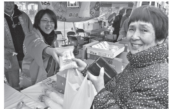
▲本宮の物産品を買い求める上尾市民の方

促進協議会の皆さんが来店し、本宮烏骨鶏の焼き鳥をはじめ、新鮮な野菜や果物などを販売し、2日間で全て完売と好評をえました。