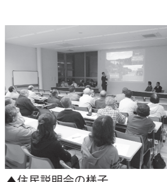
▲住民説明会の様子