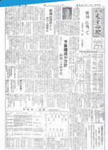
昭和34年7月1日発行「広報もとみや」No.1