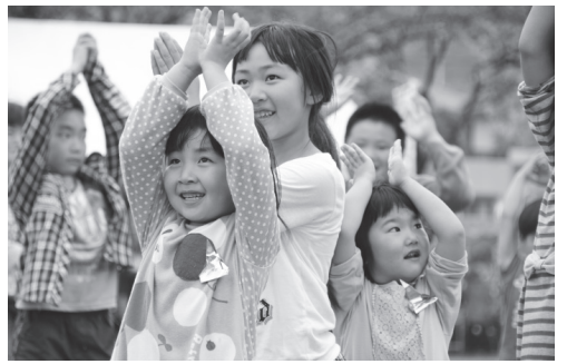
▲みずいろ公園は子どもたちの笑顔であふれた

会場は大きく5つの ブースに分かれていまし た。チャレンジコーナー では、手づくりビーズや 科学実験など体験できる 遊びが多くありました。 おはなしコーナーではお はなしボランティアの方 などによる絵本の読み聞 かせや紙芝居が、ちびっ こコーナーではトランポ リンやわなげ、縄跳びな ど体を動かす遊びが多く ありました。また、消防