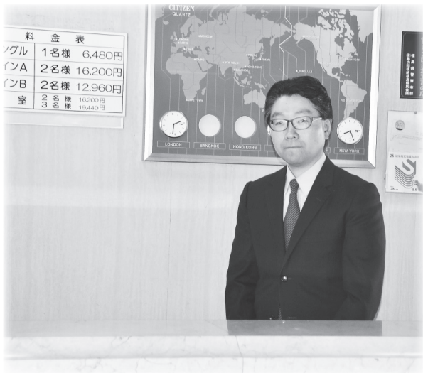
本業はホテル業の北沢さん。フロントでお客さんを迎えます