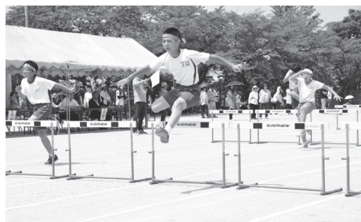
▲学校対抗でがんばりました