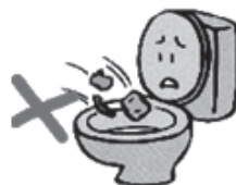
水洗トイレ用以外の紙