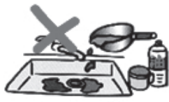
天ぷら油などの廃油