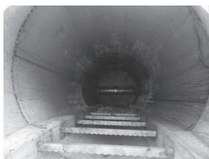
良好なマンホールの状態

グリース阻集器は、定期的な点検・清掃をしてください。清掃をしないとグリースを阻集する機能が低下して油脂が流出し排水管・下水管の詰まりや悪臭の原因になります。