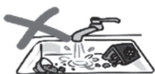
野菜くずや食べ残し