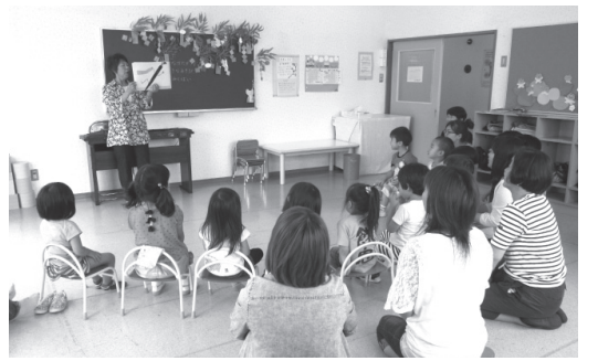
プレ幼稚園の様子

五百川幼保総合施設の敷地内に地域子育て支援センターがあります。 支援センターは、保護者のみなさんの子育てを応援することを目的として、センター内の開放、イベント開催、プレ幼稚園、出張ひろば、育児相談、情報発信などを行っています。毎日数組の親子が訪れ、プラレールやままごと、砂遊びなどに触れゆったりと楽しんでいます。 ベビールームは畳の部屋となっており、赤ちゃんが安心してハイハイすることができます。ハイハイしていた赤ちゃんが次に来たときはつかまり立ちできるようになっていたり、まだおしゃべりしなかったお子さんが話せるようになっていたりして子どもさんの成長