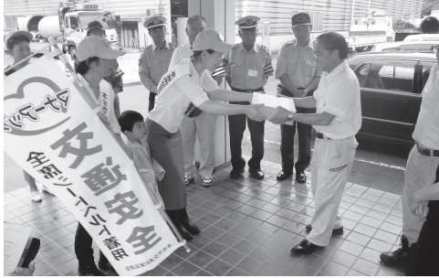
事業所を訪問し、交通安全を呼びかける参加者

運動初日の16日には、郡山北警察署本宮分庁舎を出発し、啓発広報パレードを行いながら、事業所訪問や街頭で交通安全を呼びかけました。