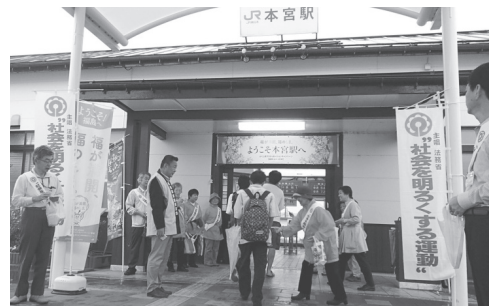
本宮駅前街頭啓発を行う皆さん

7月1日、JR本宮駅前「社会を明るくする運動」の街頭活動が行われました。これは、立ち直ろうと決意した人を社会で受け入れていくことや、犯罪や非行をする人を生み出さない家庭や地域づくりをめざすこととした全国一斉の運動です。 「犯罪や非行を防止し、立ち直りを支える地域のチカラ」をキーワードに、本宮・大玉地区の保護司会や更生保護女性会の皆さんなどが、通勤・通学の皆さんに標語入りティッシュを配り、街頭運動を行いました。