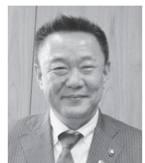
本宮市長 高松 義行