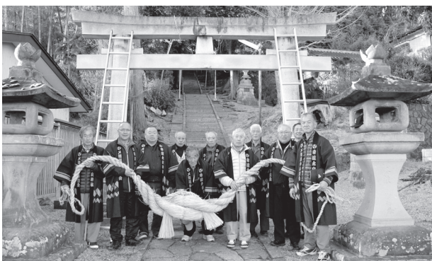
安達太良神社にしめ縄を奉納するメ縄講中奉賛会の皆さん

メ縄講中奉賛会は、安達太良神社のお膝元の北町の有志の皆さんで組織され、伝統の技でわらを編み、長さ約7メートルのしめ縄を完成させました。しめ縄は、毎年春・夏・秋・正月の年4回作成します。