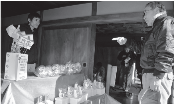
蛇の鼻御殿内では縁起物の販売がありました

蛇の鼻御殿内に祭られる五穀豊穡・商売繁盛の御利益があるとされる蛇の鼻聖観音に参拝できるほか、縁起物のだるまや「福まさる」の販売がありました。多くの来園者が、参拝し、福を買い求めています。