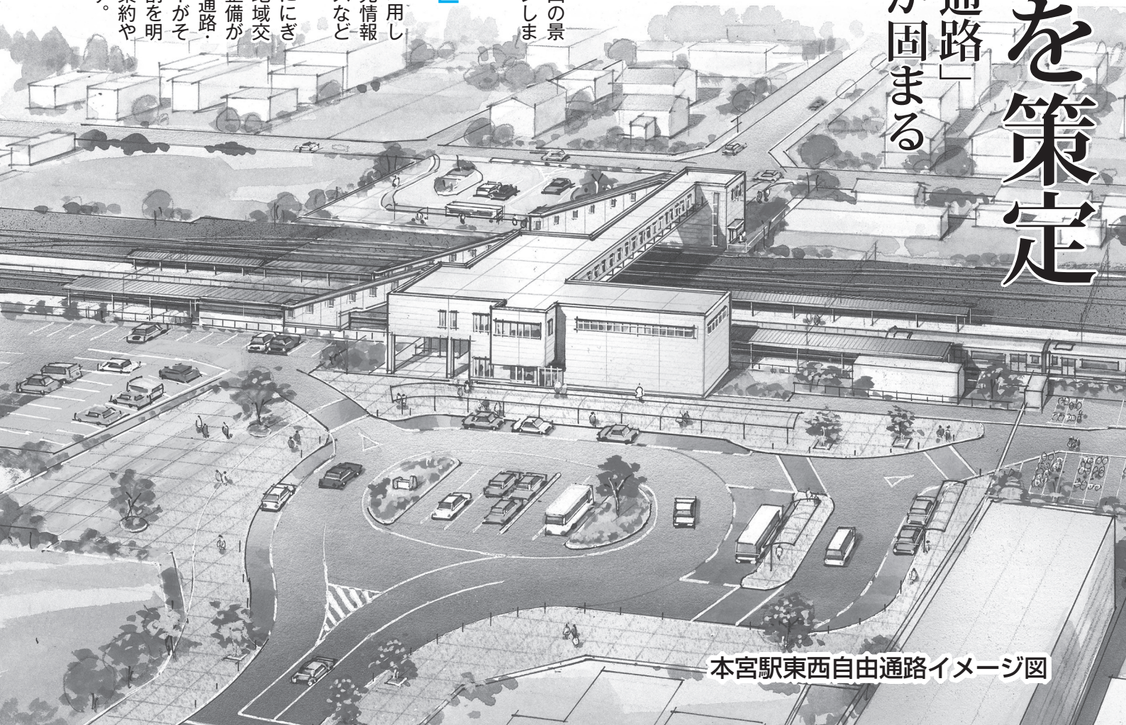
本宮駅東西自由通路イメージ図

自由通路の空間を活用して、待合スペースや観光情報スペース、展示スペースなどを確保します。 また、現在、駅周辺ににぎわいを創出するため、地域交流センター（仮称）の整備が検討されています。自由通路・駅舎と地域交流センターがそれぞれに果たすべき役割を明確にしながら、機能の集約や一体的な運営を図ります。