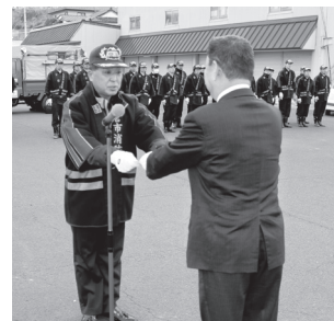
市長から国分団長に車両が交付されました

3月13日、本宮市消防団の車両交付式が行われ、白沢第3分団にポンプ車が、白沢第1分団に小型ポンプ積載車が配備されました。