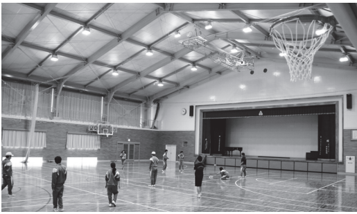
耐震補強改修工事が完了した白沢中学校体育館