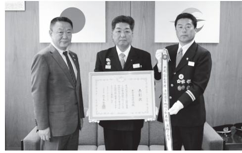
本宮市消防団の国分団長(中央)と国分副団長(右)

3月6日、消防庁主催の消防庁消防団等表彰式が東京都千代田区で行われ、本宮市消防団が消防団等地域活動表彰を受賞しました。これは地域に密着した消防活動と団員確保への取り組みが認められたことによるものです。