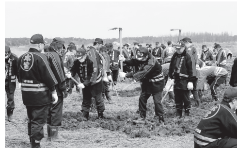
浪江町請戸地区で捜索する消防団員

東日本大震災から5年となった3月11日、浪江町の行方不明者一斉捜索に本宮市消防団の団員100人が参加しました。