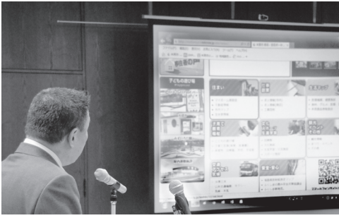
記者にポータルサイトの説明をする高松市長