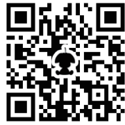
移住・定住ポータルサイトのQRコード

高松市長は、2月25日の市長定例記者会見で市の定住促進を目的とした「移住・定住ポータルサイト」の運用開始を発表しました。(http://www.city.motomiyagi.jp/site/teiyu/ 市の公式ホームページで見ます) サイトでは、定住者確保のため「住まい」や「雇用」、「子育て支援」などに関する情報を随時発信していきます。