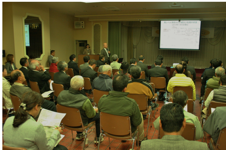
白沢公民館で開催された講演会の様子