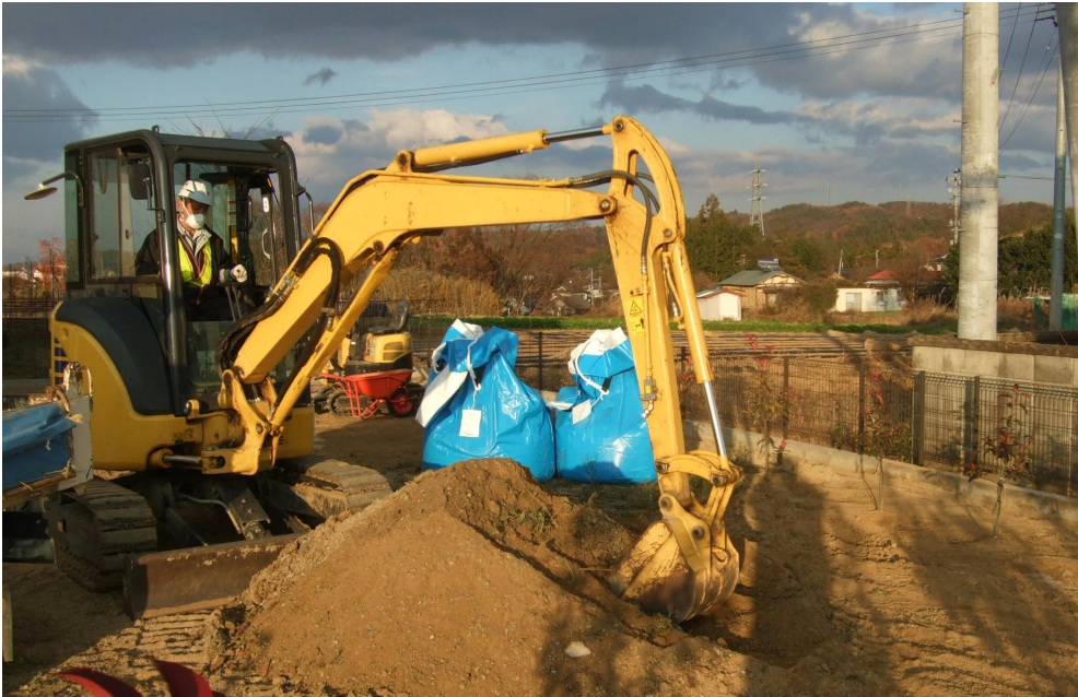
除染作業が進む仁井田地区