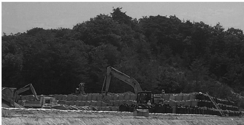
▲フレコンバッグの搬入が進む高木地区仮置き場

います。関下・高木地区では、搬入作業が進んでいます。その他の地区でも造成、設計、候補地選定作業を行っています。仮置き場は、住宅除染を効率的に進めるうえで必要不可欠なものです。設置について、地域