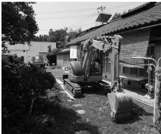
▲白岩地区での除染作業の様子