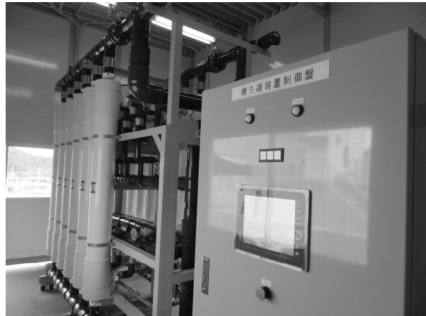
▲運用を開始した仮設ろ過設備