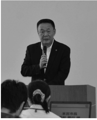
▲あいさつする高松市長 ▶あいさつする根本復興相 ▼パネルディスカッションの様子