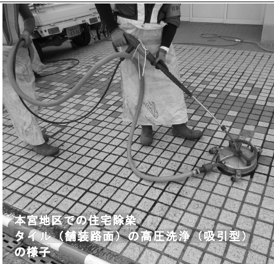
本宮地区での住宅除染 タイル（舗装路面）の高圧洗浄（吸引型）の様子

現在、糠沢・荒井・本宮地区で除染作業を進めています。間もなく糠沢地区の除染作業が完了となります。 青田・岩根地区では、事前調査を行っており、準備が整い次第、除染作業に入ります。 事前調査は、作業のスピードアップを図るため、作業前に建物の配置を確認させていただくなど簡易な調査です。調査員が訪問しましたら、ご協力をお願いいたします。