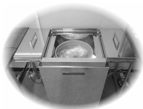
▲きざまずに測定できる非破壊式放射能測定装置