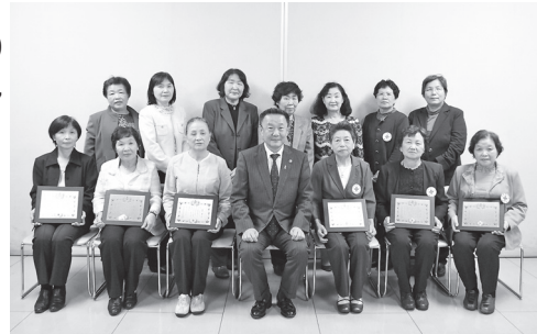
受章された赤十字奉仕の皆さん

10月17日、郡山市で行われた日本赤十字社主催の「赤十字ボランティアのつどい」で、金色有功章に白沢赤十字奉仕団員1人、銀色有功章に本宮赤十字奉仕団員4人、白沢赤十字奉仕団員5人が受章されました。表彰は、活動年数が20年以上の人に金色有功章、15年以上の人に銀色有功章が贈られます。