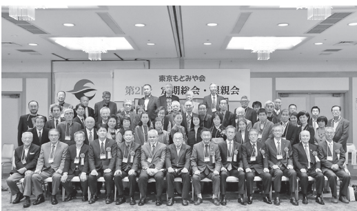
ふるさとへの応援を誓った東京もとみや会の皆さん