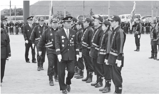
通常点検を受ける消防団団員の皆さん

通常点検、中隊訓練を実施した後、ラッパ隊のドリル演奏が披露され、火災の多くなる時期に備え、「火の用心」の心構えを新たにしました。