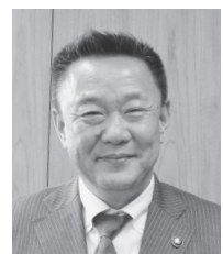
本宮市長 高松義行