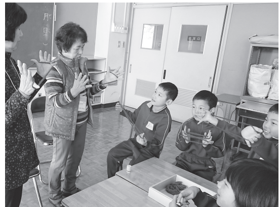
ボランティアさんからむかしあそびを教わる児童

初めて遊ぶ子どもたちもいるなか、ボランティアの皆さんがお手本を見せ、遊び方を学び、交流を深めてい