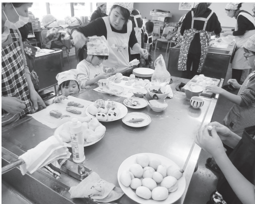
パン作りを楽しむ参加者

当日は、一般や親子連れなど20人が参加して、パンの生地づくりから、成形や飾り付け、オーブンでの焼き上げまで一緒に行い、パン作りを楽