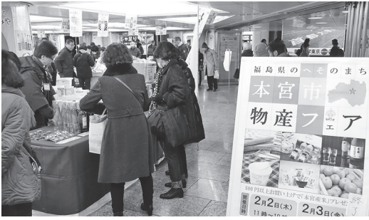
JR 新宿駅西口広場で行われた本宮市物産フェア

このイベントには首都圏販売促進協議会より9事業者が出店し、市の特産品や地酒、銘菓、新鮮な野菜や加工食品などの販売と観光PRを行いました。500円以上お買い上げの人へは本宮産コシヒカリのプレゼントなどの特典もあり、2日間を通し多くの人々が訪れ、本宮産の野菜は初日ではほぼ完売となるほど好評でした。