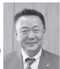
本宮市長 高松義行