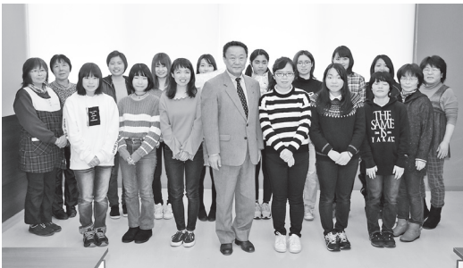
ツアーに参加した相模女子大の学生 13人

9日には市役所で歓迎会が開かれ、高松市長から参加者に記念品として市のキャラクターグッズが手渡されました。