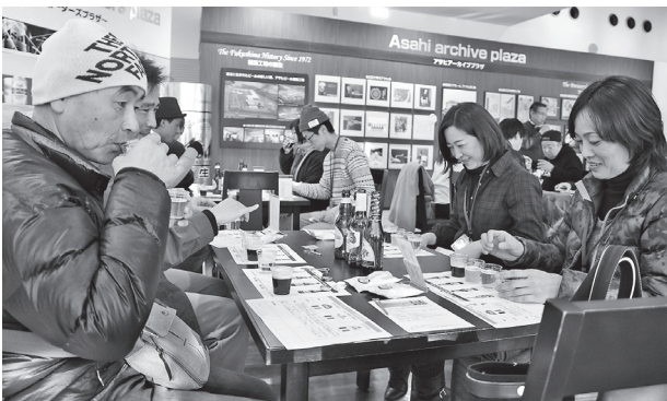
それぞれに特徴的なベルギービール3種を飲み比べる参加者

アサヒビール福島工場では2月11日・18日・25日の3日間、世界のビール講座と題し、工場見学に加えベルギービールの魅力に触れられるイベントを開催しました。ベルギービールの特徴や作り方を学べる講座やベルギービール3種のテイastingも行われました。参加者は、個性豊かなベルギービールと出来たてのアサヒビールを楽しみました。