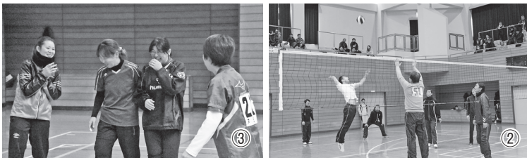
①地区全体が息を合わせた男女混合家庭バレーボールの部 ②激しい試合が展開された男子バレーボール大会 ③バレーを通して地区の絆を深めていた