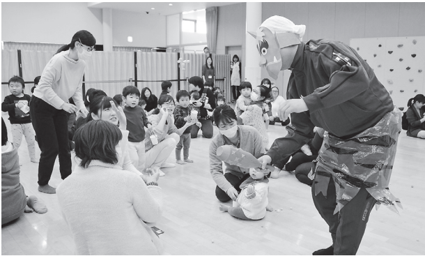
鬼めがけて豆を投げる親子連れ

2月3日、えぼかでは節分のつどいが催されました。親子連れ約75人が参加し、職員から豆まきの由来や紙人形劇が披露されたほか、参加者全員で豆まきの歌を歌いました。鬼が登場すると、子どもたちは自分たちで作った豆入れから豆をつかみ、大きな鬼めがけて投げ込んでいました。泣いてしまう子もいる中、みんなで力を合わせて鬼を退治しました。