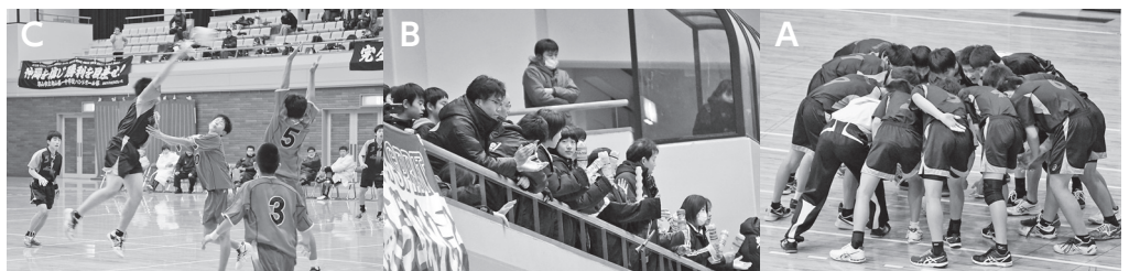
A：県大会。円陣を組み試合に臨む一中ハンド部 B：見守る保護者の皆さん C：熱戦を繰り広げた決勝の郡山一中戦