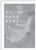
『ママ、いのちをありがとう。』 池川 明