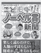
『子どもノーベル賞新聞』 若林 文高