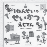
『1ねんせいせいがついてん』 WILL 子ども知育研究所