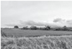
【主な設問と回答結果】