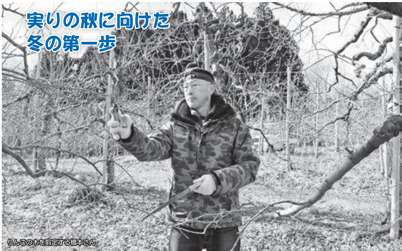
実りの秋に向けた 冬の第一歩